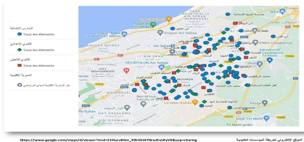
Figure 1 : Localisation des institutions primaire publiques de la direction de sidi el Bernoussi

Pour l'analyse des données, nous avons utilisé le logiciel SPSS, reconnu pour sa fiabilité dans le traitement statistique. Les données ont été traitées principalement à l'aide d'analyses descriptives, permettant de résumer et de présenter les informations de manière claire. Cela inclut le calcul de fréquences, moyennes et écarts-types afin d'identifier les tendances et variations au sein de l'échantillon. Cette approche offre une vision synthétique des résultats avant toute analyse plus approfondie.