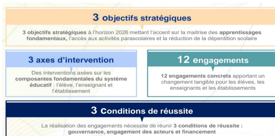
Figure 1 : les composantes de la feuille de route

La Feuille de route 2022-2026 pour l'école publique constitue l'un des chantiers stratégiques majeurs initiés par le ministère de l'Éducation nationale au Maroc. Elle s'inscrit dans la continuité de la Vision stratégique 2015-2030 et de la Loi-cadre 51.17, tout en visant une opérationnalisation concrète et progressive des réformes éducatives. Conçue comme un instrument de pilotage et de mobilisation, cette feuille de route fixe des objectifs précis en matière d'amélioration de la qualité des apprentissages, de réduction des inégalités scolaires et de renforcement de la gouvernance. Elle traduit la volonté de doter le système éducatif marocain d'une stratégie pragmatique, mesurable et centrée sur les résultats, afin de répondre aux défis actuels et futurs de l'école publique.